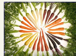
Na zdjęciu widać różne rodzaje marchwi (różne kolory) :)